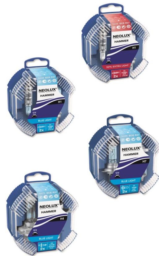
Старый тип упаковки - двойной пластиковый бокс