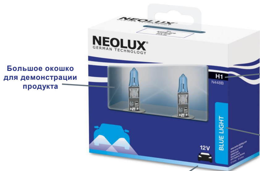
Новый тип упаковки - двойной картонный бокс

Большое окошко для демонстрации продукта